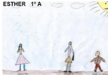
ESTHER 1º A