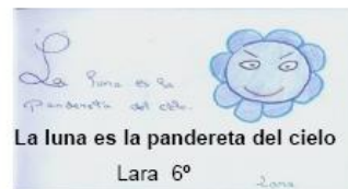
La luna es la pandereta del cielo