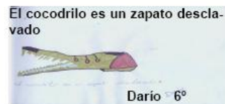
El cocodrilo es un zapato desclavado