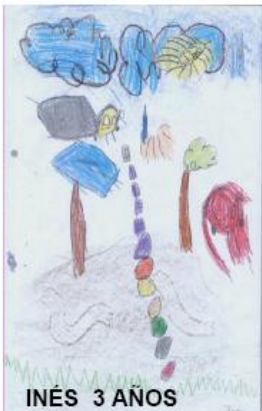
INÉS 3 AÑOS