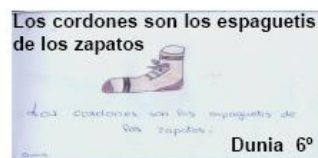
Los cordones son los espaguetis de los zapatos