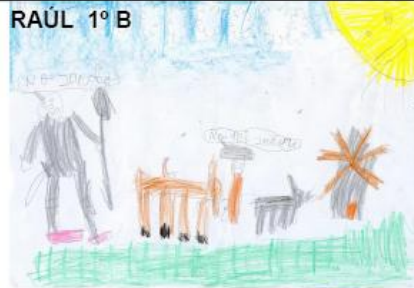
RAÚL 1º B