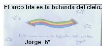
El arco iris es la bufanda del cielo.