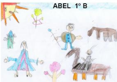
ABEL 1º B