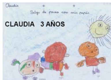
CLAUDIA 3 AÑOS