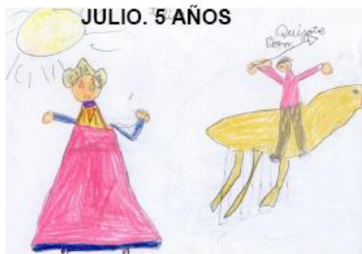
JULIO. 5 AÑOS